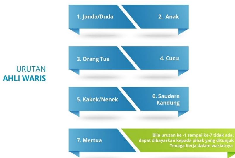
Gambar 3.5 Urutan Ahli Waris bagi Peserta Program Jaminan Kematian

Contoh Kasus : Seorang Peserta Program Jaminan Kematian di BPJS Ketenagakerjaan Kantor Cabang Kota Bogor mengalami indikasi kecurigaan dari Petugas (Penata Madya Pelayanan JKK/JKM) dikarenakan ahli waris jatuh ke tangan Kakak dari Orang Tua Peserta (Uwa). RT/RW telah membuat Surat Keterangan terkait Kematian dan Ahli Waris, sehingga Petugas melakukan wawancara kepada tetangga di lingkungan sekitarnya, dengan bertanya perihal apa benar Peserta tidak memiliki Ahli Waris sehingga jatuh kepada sanak saudara yang lain.