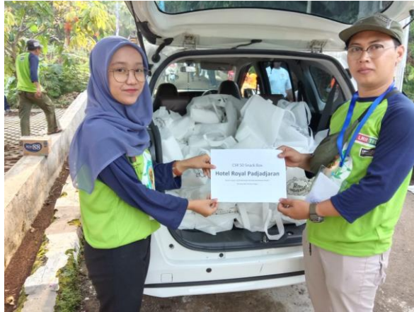
Gambar 3. Salah Satu Kegiatan Program CSR