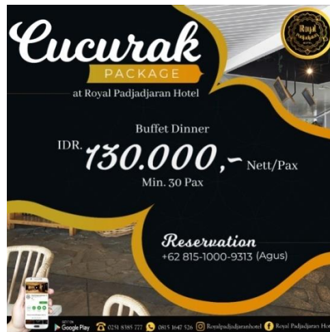
Gambar 2. Paket Promo Cucurak

Hotel Royal Padjadjaran Bogor menjalankan unit program CSR ( Corporate Social Responsibility ) atau Tanggung Jawab Sosial Perusahaan. Hal ini berdampak pada meningkatnya citra positif Hotel di lingkungan Masyarakat.