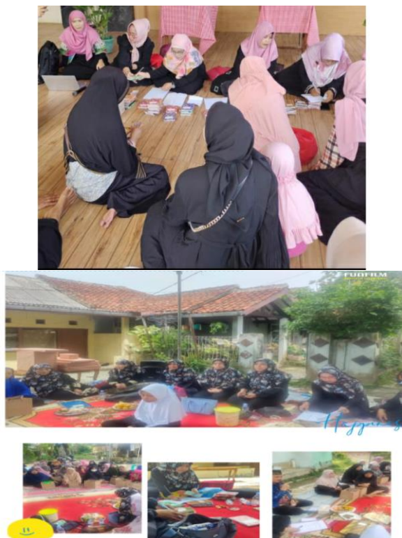
Gambar 1. Keterlibatan tim dosen IBI Kesatuan dalam kegiatan UPPKS Matahari Hasil dari pendampingan berkelanjutan ini memberikan beberapa manfaat sebagai berikut: