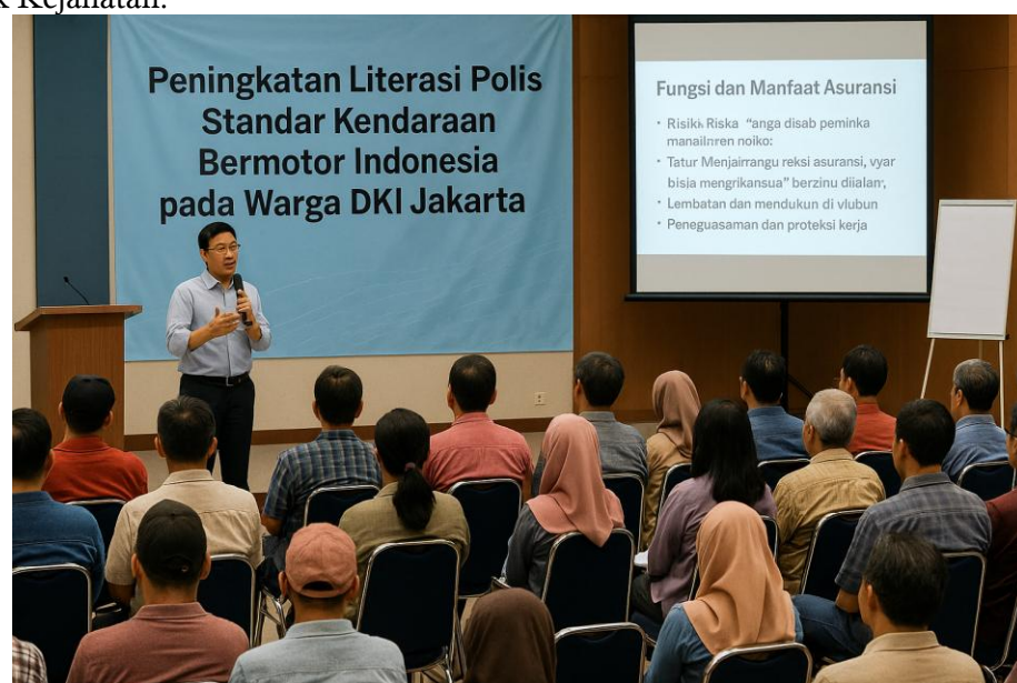
Gambar 1 Sosialisasi Kepada Warga Masyarakat

Pada pembukaan atau preamble dinyatakan bahwa atas dasar permintaan Tertanggung dalam Proposal form untuk mengasuransikan kendaraan bermotornya, maka penanggung dengan ini menyatakan memberikan perlindungan pada Tertanggung terhadap kerugian dan/atau kerusakan akibat gesekan, benturan, tabrakan dengan syarat dan kondisi polis yang tercantumkan dan/atau dilekatkan dalam polis. Selanjutnya pada schedule Polis memuat semua data mengenai kendaraan bermotor seperti merk, tipe, tahun pembuatan, dan lain-lainnya terkait data penggunaan kendaraan, maupun jangka waktu mulainya pertanggungan dan masa polis. Pada bahasan Risiko yang Dijamin terdapat Jaminan Kecelakaan Kendaraan, Perbuatan Jahat Pihak lain dan Jaminan Pencurian. Selanjutnya terdapat Jaminan Kebakaran yang menjamin berbagai penyebabnya yaitu: Asal kebakaran, Kerusakan akibat pemadaman, dan Pemusnahan Atas Perintah pihak berwenang. Juga terdapat perlindungan di atas Kapal Penyelbrangan. Risiko Dijamin berikutnya adalah Tanggung Jawab Hukum Pihak Ketiga, yang terdiri dari Kerusakan Harta Benda milik orang lain, Biaya Pengobatan dan Cidera Badan, dan Kematian. Serta yang terakhir adalah Jaminan Biaya Hukum. Lebih lanjut resiko-resiko yang dikecualikan anata lain penggunaan kendaraan bermotor untuk menarik/mendorong, pelajaran mengemudi, kegiatan Publik, Perlombaan /Hobi Kecepatan dan Tindak Kejahatan.