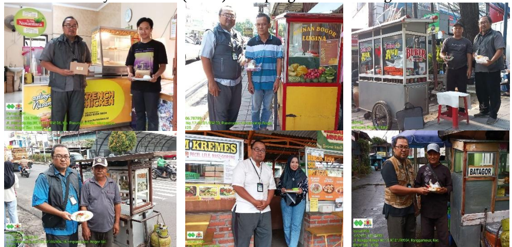
Gambar 1.: Observasi Lapangan

Tim melaksanakan observasi lapangan untuk mengidentifikasi permasalahan spesifik yang dihadapi mitra. Hasil observasi ini digunakan sebagai dasar penyusunan solusi teknis agar tepat sasaran. Selanjutnya, dilakukan sosialisasi awal mengenai pentingnya peningkatan Sumber Daya Manusia (SDM) serta pengelolaan keuangan usaha.