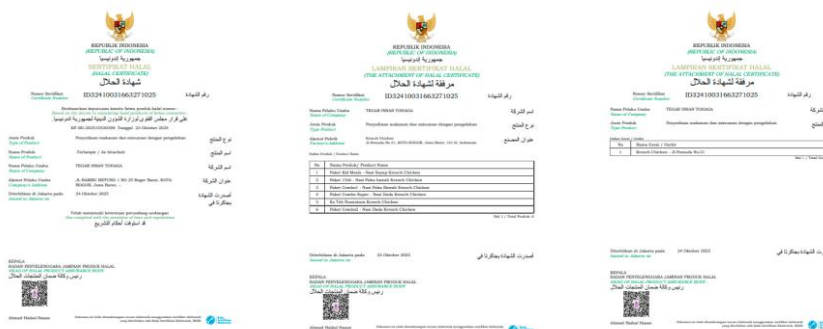
Gambar 2.: Contoh Sertifikat Resmi Diterbitkan