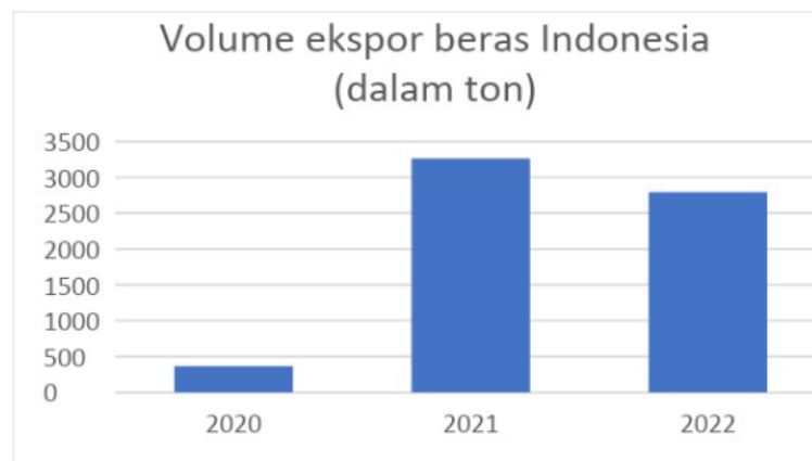
Gambar 3. Volume ekspor beras indonesia (dalam ton)

Volume impor beras Indonesia menunjukkan tren yang fluktuatif pada periode tahun 2017-2019 dengan rata-rata sebesar 1,016 juta ton tiap tahun. Volume impor beras Indonesia di tahun 2017 sebesar 305.274 ton dan melonjak cukup tinggi di tahun 2018 sejumlah 2,3 juta ton dengan persentase sebesar 638,3%. Akan tetapi, pada tahun 2019 Indonesia hanya mencatatkan 444.508 ton volume impor beras. Hal tersebut menandakan penurunan yang sangat drastis dengan persentase mencapai 80,27%. Pada Desember 2019, dunia dan juga Indonesia dikejutkan dengan penemuan sebuah virus yang berasal dari kota Wuhan, Tiongkok yang setelahnya dikenal dengan virus covid-19. World Health Organization (WHO) mengumumkan covid-19 menjadi pandemi dunia pada tanggal 9 Maret 2020 sebelum akhirnya Indonesia mencabut status pandemi pada Juni 2023. Setelah itu pemerintah Indonesia juga mulai mencegah penyebaran covid-19 melalui kebijakan-kebijakan yang membatasi mobilitas masyarakat, termasuk mobilitas barang dan jasa yang pada aktivitas ekspor dan impor. Komoditi beras pun juga ikut merasakan dampaknya. Penurunan yang drastis terjadi pada volume ekspor beras.