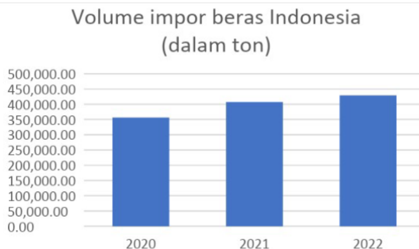
Gambar 3. Volume rata-rata ekspor beras Indonesia (dalam ton)

Volume rata-rata impor beras Indonesia selama rentang tahun 2020-2022 menyentuh angka 397.744 ton dengan jumlah yang meningkat tiap tahunnya. Pada tahun 2020 volume impor beras menyentuh angka 356.286,2 ton dan kemudian meningkat sebesar 14,45% di tahun 2021 dengan volume sebanyak 407.741 ton. Kenaikan ini berlanjut di tahun 2022 yaitu sebesar 5,26% dengan volume impor di tahun tersebut sebanyak 429.207 ton. Tren volume impor beras yang meningkat selama masa pandemi ini menunjukkan adanya ketidakmampuan pemerintah dalam memenuhi kebutuhan beras nasional secara mandiri sehingga harus bergantung pada hasil impor.